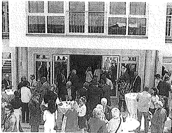
Etwa 100 Gäste nahmen am Empfang in der Seniorenresidenz teil.